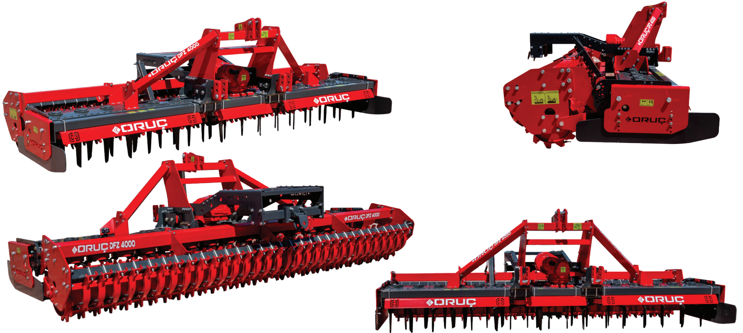
AĞIR TİP DİKEY TOPRAK FREZESİ TEKNİK ÖZELLİK LİSTESİ /// HEAVY TYPE POWER HARROW SPECIFICATIONS